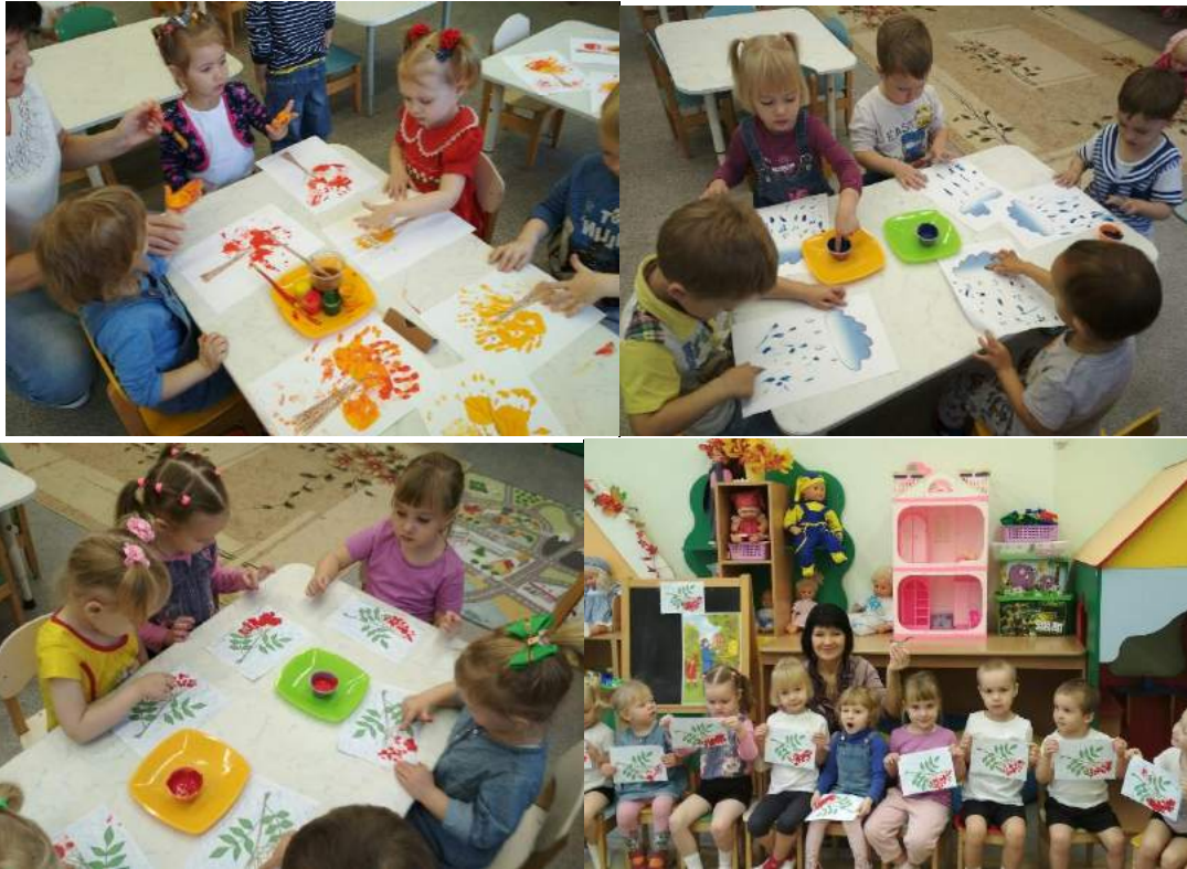
Рисовали осенние деревья ладошками. Дождик и кисть рябины рисовали пальчиками. «Ой ребята! Набежала тучка, заплакал дождь»