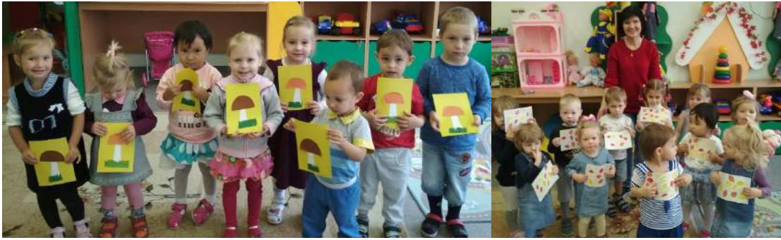
Клеили аппликации грибов, осенних листьев.